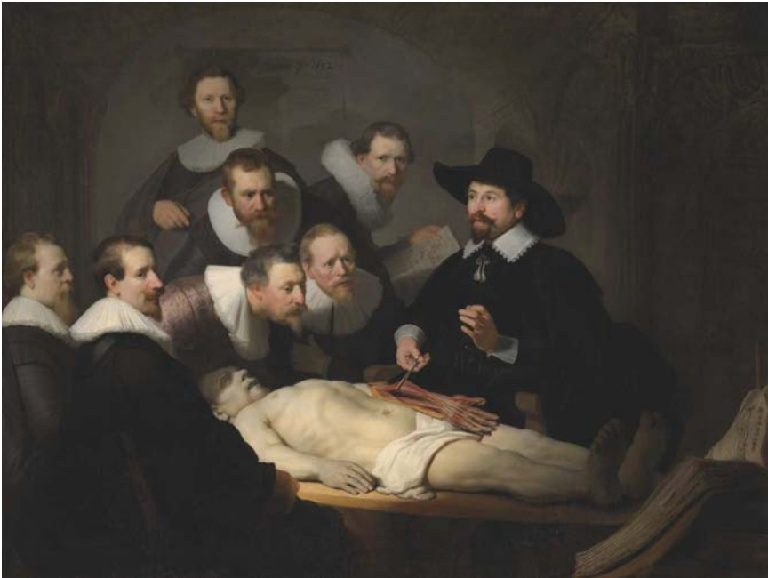
FIGURA 11. Rembrandt H. van Rijn, La lección de anatomía del Dr. Nicolás Tulp , 1632, óleo sobre tela, 216.5 × 169.5 cm, Mauritshuis, La Haya.